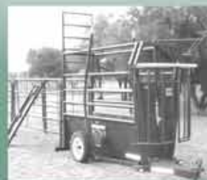
Mobiele Drukgang & Nekklamp