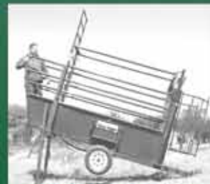
Mobiele Werk & Laaibank