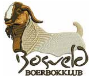
Die klub se embleem.

Hierdie klub gaan uit sy pad om te sorg dat sy lede altyd oor genoeg inligting beskik om 'n sukses van hul boerdery te maak. Dit sluit selfs hul eie webwerf, vraerubrieke en opleidingsessies in.