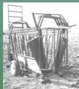
Mobiele Nek & Lyfklamp